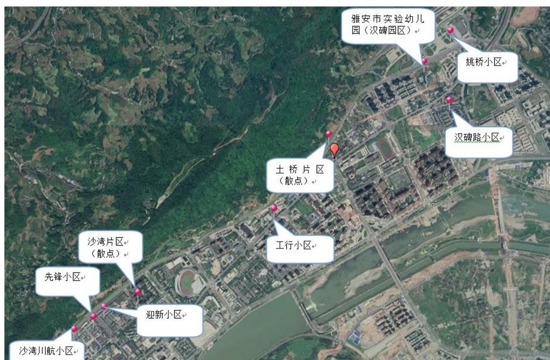
图 2.1-1 项目具体涉及点位分布示意图

本项目沿小区道路或自然路面合适位置布置污水管道集检查井，并在检查井与居民户排污口之间布置 U-PCV 收集管，收集该片区生活污水。并对沙湾社区迎新小区、先锋小区、沙湾川航小区等内部管网级设施进行清掏和破损修复。