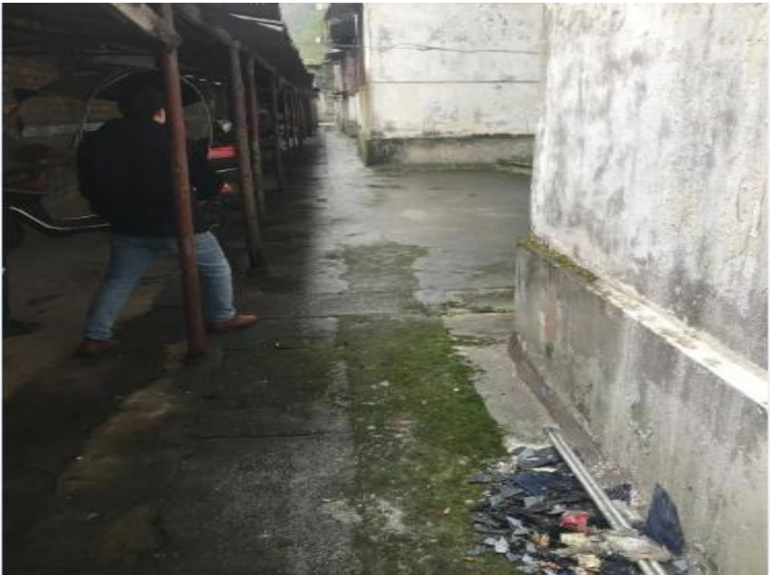
照片 1：项目区原始地貌情况 1