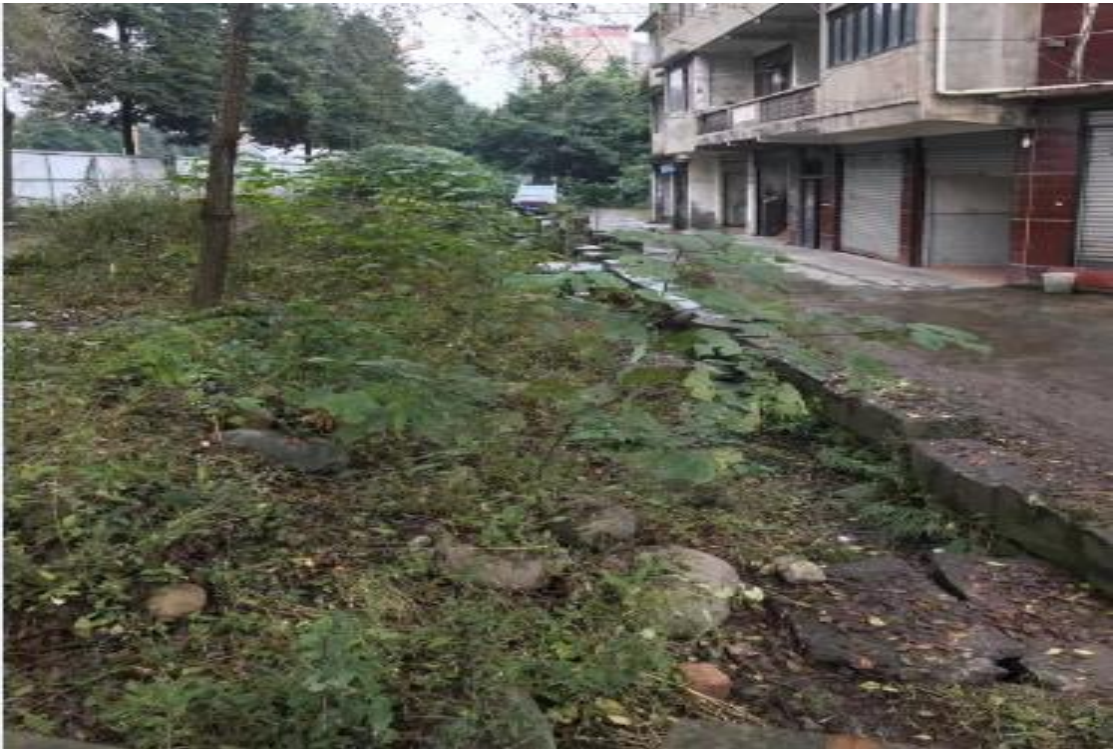
照片 2：项目区原始地貌情况 3